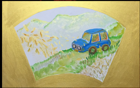
ワークショップ作品イメージ